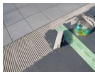
3. Fliesen mit codex Fliesopur verlegen.