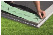
2. Abdichtung auslegen und Stöße verkleben. (1)