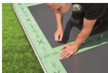
2. Abdichtung auslegen und Stöße verkleben. (2)