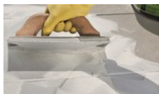
4. Nach Begehbarkeit mit codex EpoTix verfugen.